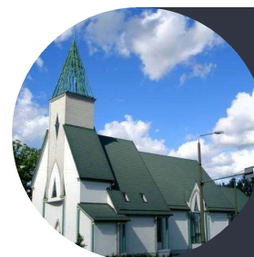
TARTU SALEMI BAPTISTIKOGUDUS

E-post: salem@salem.ee Telefon: 734 3664 Address: Kalevi 76 Tartu 50104 SEB pank: EE461010152001809009 Swedbank: EE832200221005109196